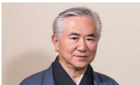
遠州茶道宗家、十三世家元不傳庵