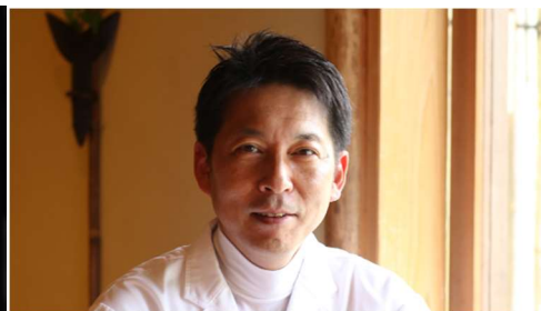
株式会社 叶 匠寿庵 代表取締役社長

オブジェマガジン「遊」編集長、東京大学客員教授、帝塚山学院大学教授などを経て、現在、編集工学研究所所長、インシス編集学校校長。80年代「編集工学」を創始し、日本文化、経済文化、物語文化、自然科学、生命科学、宇宙、デザイン、意匠図像、文字などの諸分野をまたいで関係性をつなぐ研究に従事。その成果を、様々な企画、編集、クリエイティブに展開。一方、日本文化研究の第一人者として私塾を多数開催。2000年、壮大なブックナビゲーション「千夜千冊」の連載を開始。同年、eラーニングの先駆けともなる「インシス編集学校」を創立した。近年は、知識情報の相互編集を可能とする「図書街」「目次録」、編集的世界観にもとづく書店空間など、本を媒介にした数々の実験的プロジェクトを展開。